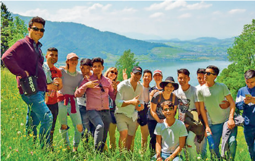
Mitglieder des kollektiv raums auf ihrer Wanderung zum Hirschenhof, Untersüren bei Zug