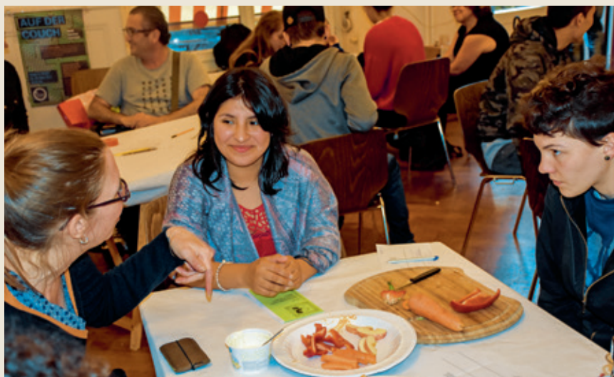
Angeregte Gespräche bei «Tapas & Beer» im Berner Kulturzentrum PROGR

Integration ist ein gegenseitiges Aufeinanderzukommen. Mit der Vision, gemeinsam eine vielfältige und offene Gesellschaft zu kreieren, in der Unterschiede als Bereicherung wahrgenommen werden, wurde der Verein Integration Zusammen gegründet.